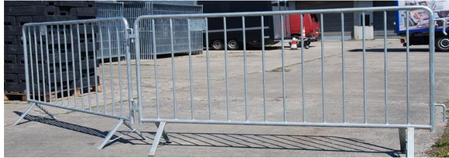
Mannesmann Gitter (Mannheimer Gitter)