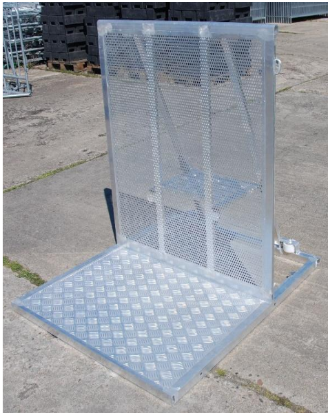
Bühngitter (Crash Barriers)