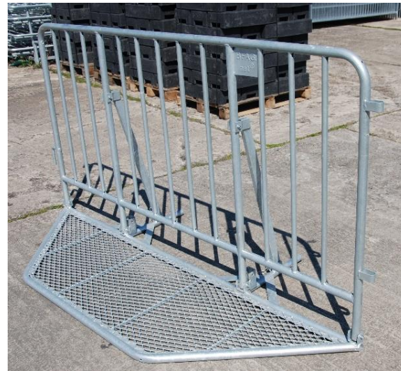
Polizeigitter (Hamburger Gitter)